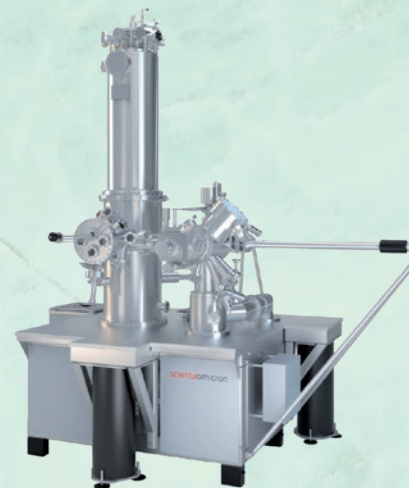
TESLA JT SPM