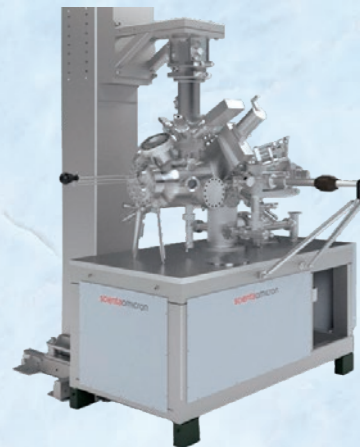
Fermi DryCool SPM